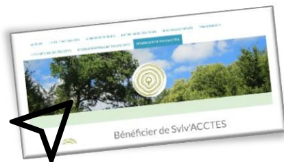
Le dépôt en ligne est disponible sur la page "Bénéficiaire de Sylv'ACCTES" du site de l'association.

Enfin, le dépôt en ligne permet à Sylv'ACCTES de gérer de manière plus fluide les demandes d'aides optimisant ainsi leur temps de traitement.