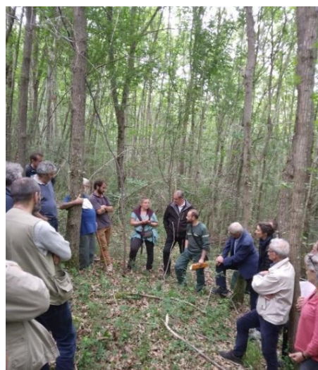
Des représentants de la Fondation de France ont participé en mai à une visite d'un chantier dans les Pyrénées Ariégeoises. La Fondation de France est le premier mécène des travaux accompagnés par Sylv'ACCTES en Occitanie.

A la Fondation de France, nous sommes engagés depuis plusieurs années dans une démarche de réduction de l'empreinte environnementale de nos activités. Nous avons réalisé un premier bilan carbone qui nous a conduit à nous interroger sur la façon de contribuer à l'effort de neutralité carbone. Nous nous sommes concertés en interne afin d'identifier quelles actions nous pouvions mettre en place pour réduire nos émissions de gaz à effet de serre et tendre vers la neutralisation de nos émissions non réductibles. Nous avons envisagé plusieurs solutions, allant de la plantation d'arbres à l'achat d'unités de réduction d'émissions carbone via des projets labellisés. Nous voulions un projet qui fasse écho à notre programme environnement et privilégier des actions de contribution carbone. Enfin, il était important pour nous de soutenir une action sur le territoire français.