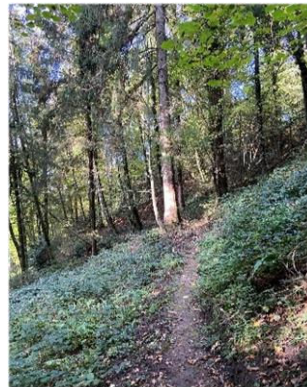
Sur ce sentier, il y a une grande diversité d'essences, ce qui est très rare et rend ainsi cette forêt vitrine aussi riche et intéressante.