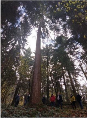
24 novembre 2021 : première visite guidée de la forêt vitrine avec les collaborateurs de Chartreuse Diffusion.

Le sentier est la concrétisation d'un partenariat avec les acteurs du massif, les équipes de l'ONF et du PNR de Chartreuse, la Région Auvergne Rhône-Alpes. Il entre également en résonance avec l'AOC Bois de Chartreuse. L'année 2022 a ainsi été l'occasion de plusieurs visites. ■