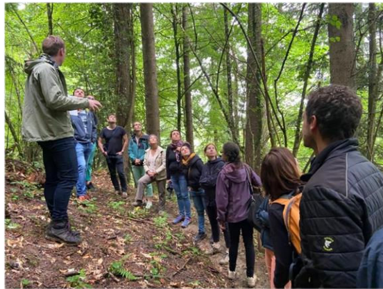
27 juin 2022 : à l'occasion de la réunion du Cercle des Entreprises pour la forêt et de son assemblée générale, l'équipe Sylv'ACCTES emmène les participants découvrir le sentier d'Aiguenoire.