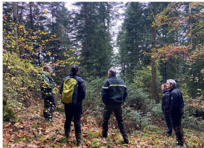
Groupe d'échanges techniques dans le Massif des Bauges.

Ces chiffres témoignent d'une excellente dynamique de travail avec les gestionnaires forestiers des différents massifs. A noter cette année, la forte progression des travaux en forêt privée qui comptent pour 530 ha.