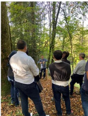
17 octobre 2022 : visite avec de nouveaux partenaires Sylv'ACCTES.