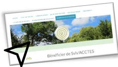
Le dépôt en ligne est disponible sur la page "Bénéficiaire de Sylv'ACCTES" du site de l'association.

Enfin, le dépôt en ligne permet à Sylv'ACCTES de gérer de manière plus fluide les demandes d'aides optimisant ainsi leur temps de traitement.